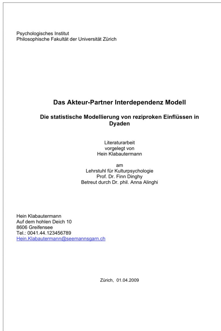
Abbildung 1: Exemplarisches Titelblatt einer Literaturarbeit

In Abbildung 1 ist ein Titelblatt exemplarisch dargestellt: